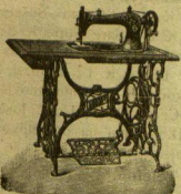
Skldište najboljih i najjeftinijih šivanih strojeva „SINGER“ najnovijih sistema.

preporuča svoj veliki izbor liepih HRVATSKIH, TALJANSKIH, NJEMACKIH I FRANCUKIH KNJIGA, romana, slovica, rječnika, onda pisanih sprava, trgovačkih knjiga, uredovnog papira, elegantnih listova za pisma, razglednica i t. d.