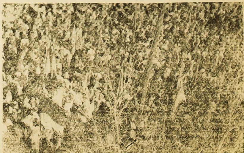
Mnoštvo naroda na mitingu prilikom oslobođenja Drniša