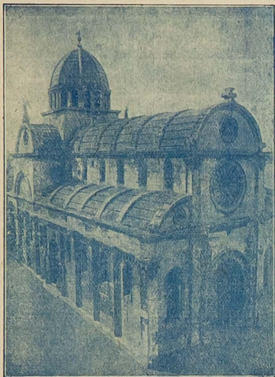
Katedrala sv. Jakova u Šibenika.