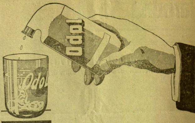
Odol se dobije u svim ljekarnama, drogerijama, parfumerijama i brijačnicama.

ODOL je najjače koncentrirana voda za usta na svijetu, nekoliko kapljica je dosta. ODOL je zato štedljiv. ODOL je zato jeftin.