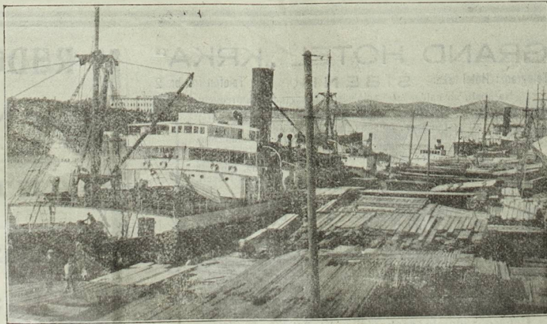
Promet na jednom dijelu stovarišta „Šipad“, o čemu ćemo u slijedećem broju dozvolom Šipadove Centrale pisati.