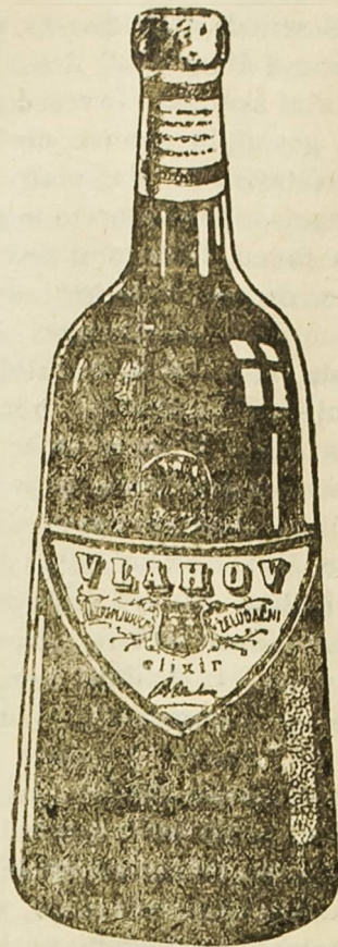
Tvornica utemeljena godine 1861.

Urednik i izdavač: Ilija Zečević. - Tisak „Pučka Tiskara“ u Šibeniku (Braća Matačić pok. Petra.