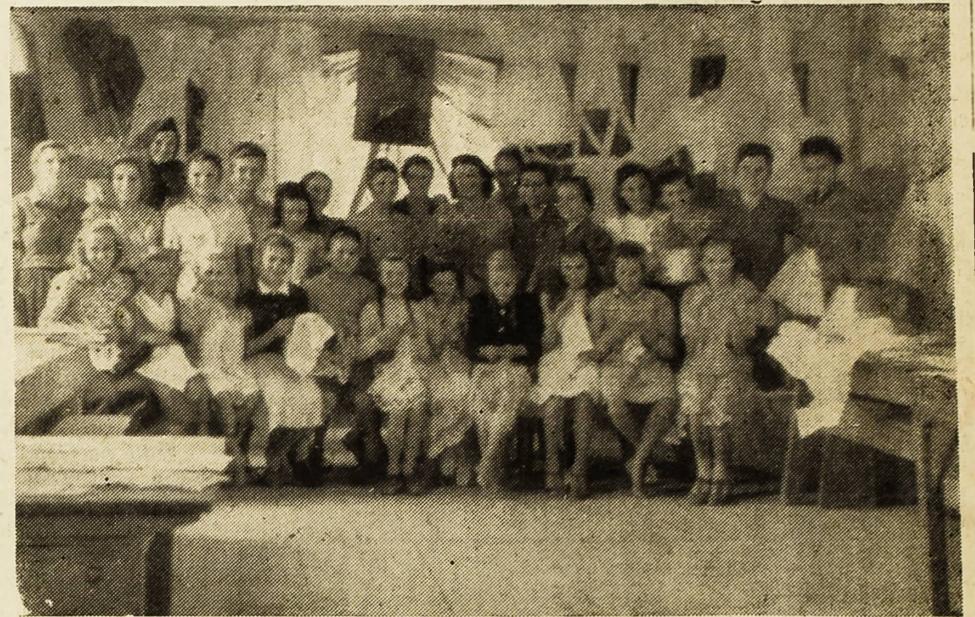
Polaznice tečaja kroja iz Prvić Luke i Šepurine

Kod današnja presude, disciplinski sud je kao olakšavajuće okolnosti uzeo u obzir što su prekršitelji ili mladi ili do sada nekažnjivani, te im je i odmjerno blaže kazne. Dujo Benaf.