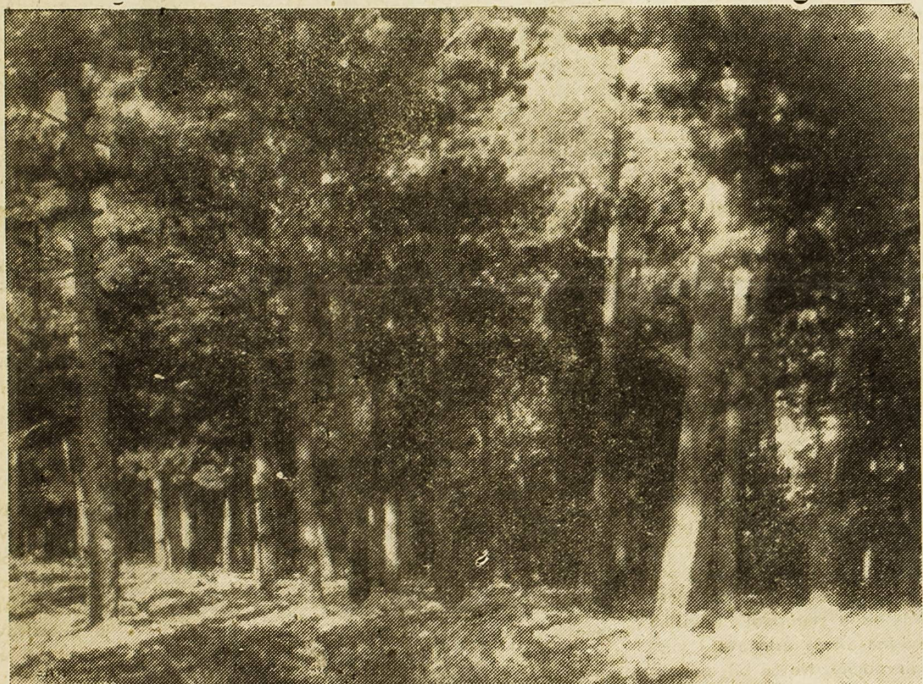
Stara borova šuma u okoljini Skradina

U istom razdoblju prošlo je kroz našu luku 67 preokooceanskih brodova i 140 jedrenjaka domaće i strane zastave. Najvećim dijelom bili su zastupljeni američki, engleski i talijanski brodovi.