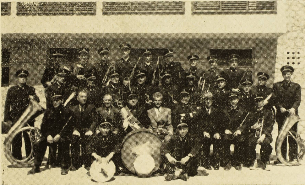
U prošlom broju našeg lista objavili smo fotografiju Šibenske narodne glazbe iz 1903. godine.

Naša slika prikazuje današnju Šibensku narodnu glazbu.