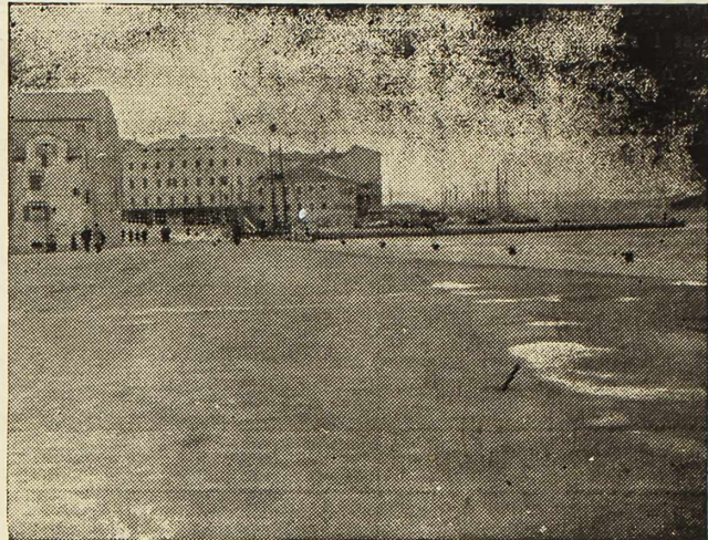
Šibenik — Putnička obala

»Lado« je profesionalno umjetničko tijelo osnovano 1948. godine kao Državni ansambl narodnih pjesama i plesova. Oko 40 članova profesionalno se bave studiranjem narodnih plesova i pjesama pod rukovodstvom stručnih koreografa Zvonka Ljevakovića i Ane Maletić. Pjesme i plesovi koje izvode članovi »Lada« misu vjerne kopije narodnih pjesama i plesova. Njihovi osnovni elementi potekli su iz naroda, dok je postava, i scenska i plesačka, rezultat studije, umjetničke analize i rada koreografa.