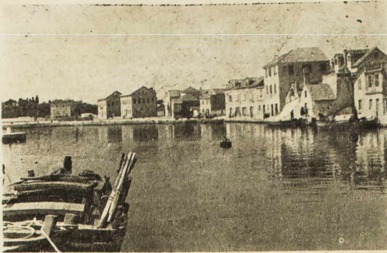
Pogled na Vodice

Neka živi 10-godišnjica Sindikata u slobodnoj Jugoslaviji!