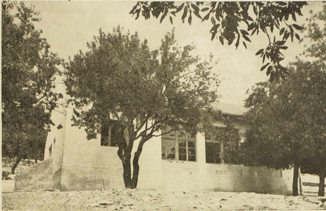
Nova školska zgrada u selu Zečevo na općini Devrske

Na zboru je govorio i drug Blaž Škugor, major JNA, koji je evocirao uspomene na pale drugove iz tog sela. Poslije natinga održano je narodno veselje.