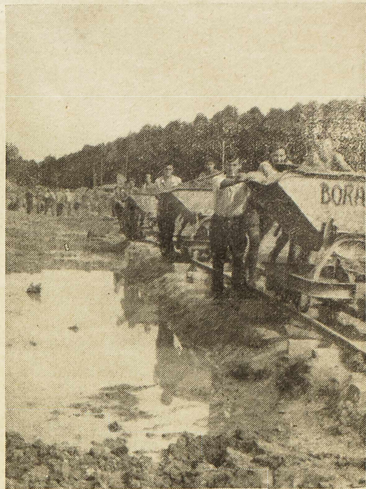
Šibenska omladina na jednoj radnoj akciji