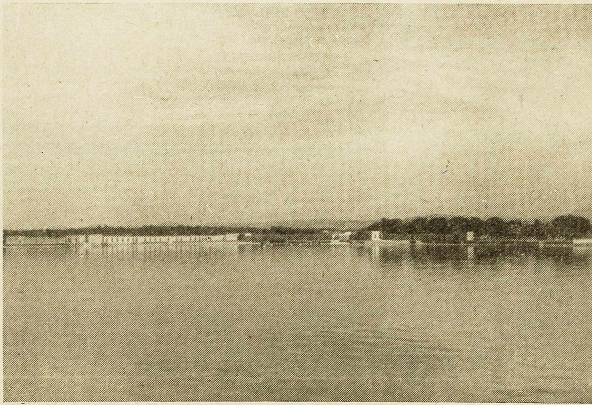
Pogled na kupalište Jadriju