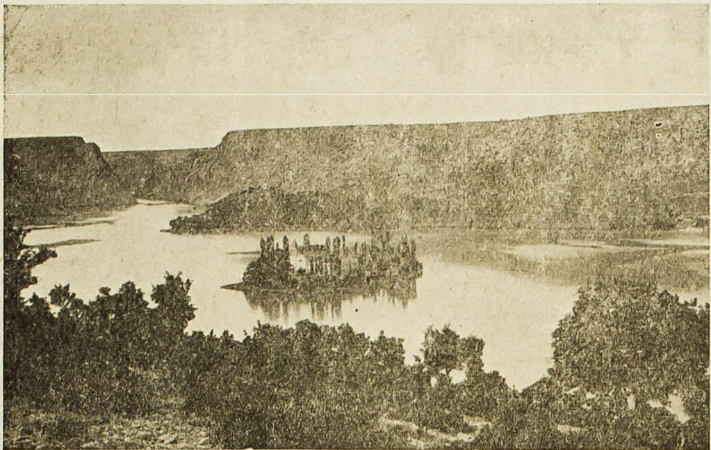
Visovac na Krki