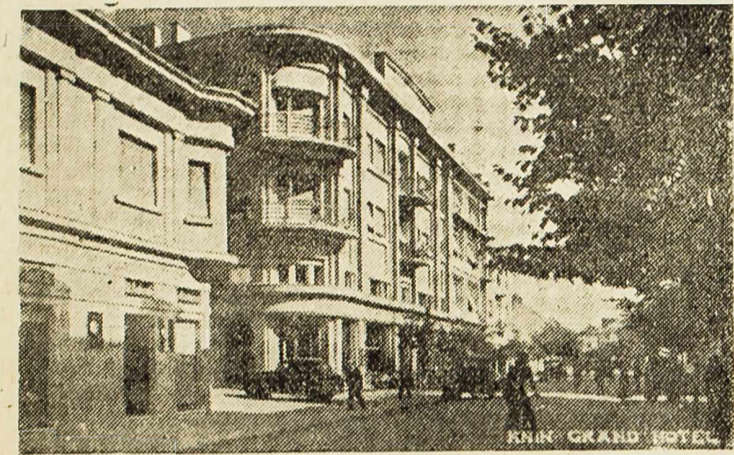
Knin: Glavna ulica