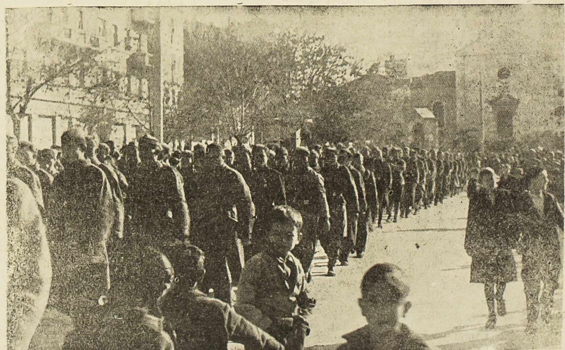
Jedinice XXVI. udarne divizije u oslobođenom Šibeniku

Prema dobivenim podacima, koji su stigli općinskoj izbornoj komisiji do 17 sati izbori su bili završeni u Ljubcu, Potkanju, Padanima, kao i na udaljenim biračištima na Prevjesu, Komu i Podinariju.