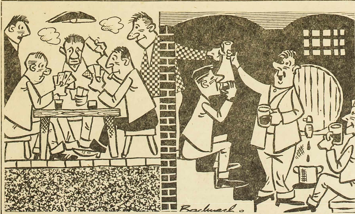
S NASTUPOM ZIMSKIH DANA U MNOGIM MJESTIMA KOTARA OSJEČA SE INTENZIVNIJI »ZABAVNI« ŽIVOT

Na svečanosti sjednici govorio je predsjednik NO-a općine Smljan Reljić, koji je iznio borbeno prošlost naroda tog kraja s posebnim osvrtom na poslijeratni privredni i društveni razvoj drniške komune. Sa sjednice su upućeni pozdravni telegrami CK SKJ i drugu Titu i CK SKH i drugu Bakariću. Nakon sjednice položeni su vijenci na spomen ploče palim borbama i strijeljanim pripadnicima Šibenskog odreda.