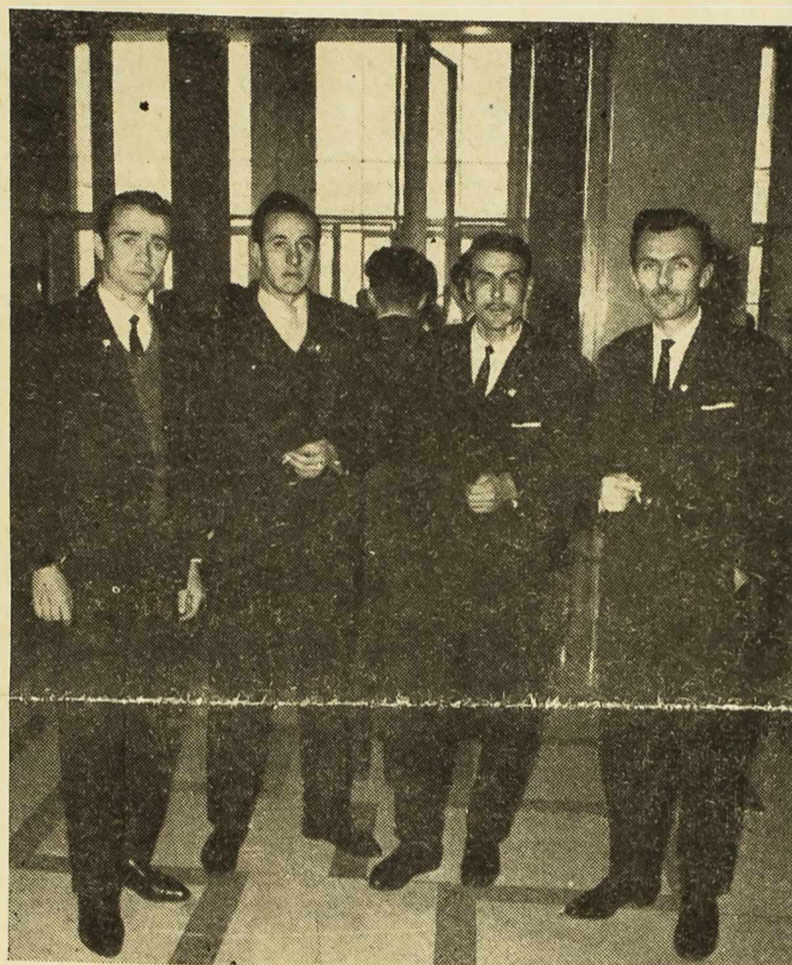
Delegati Saveza omladine općine Sibenik na VII kongresu u Beogradu

Druže Vučenoviću, vi raspoložete s nekim podacima. Zanimalo bi nas kakvo je učešće mladih u procesu proizvodnje, u organizma upravljanja i tome slično? — U ukupno 217.171 člana radničkih savjeta, njih 39.237 su