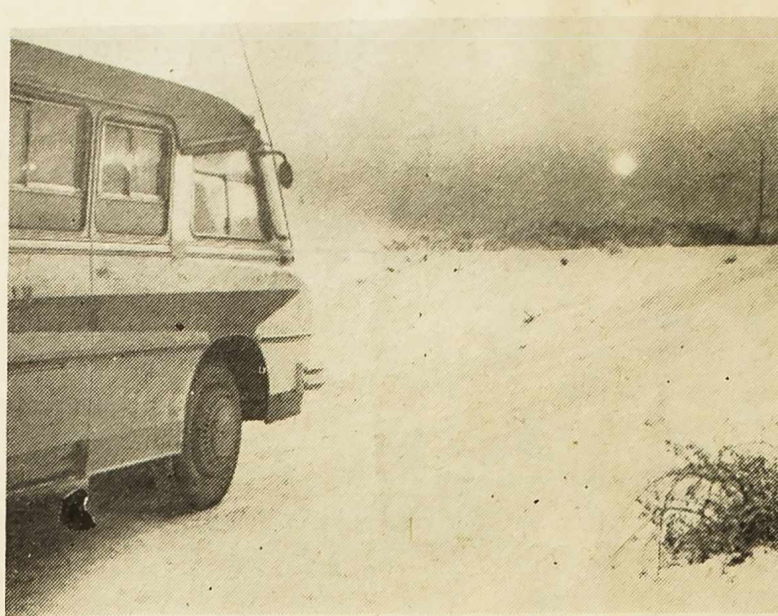
Autobusi šibenskog »Autotransporta« probijali su se kroz led na putu za Split