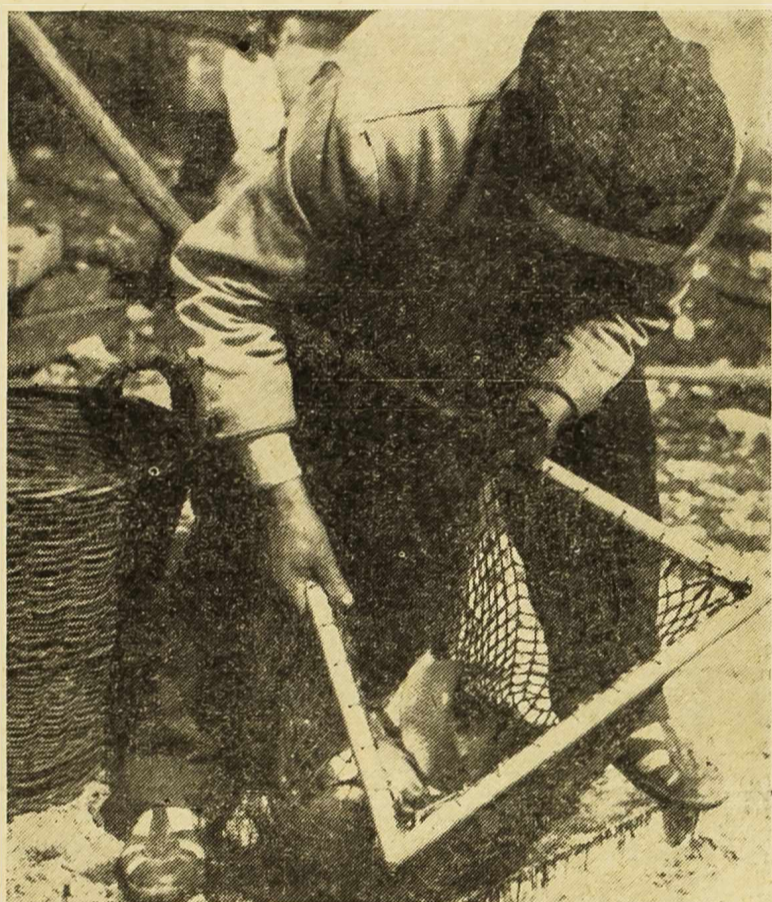
Ribar sa Prosičke