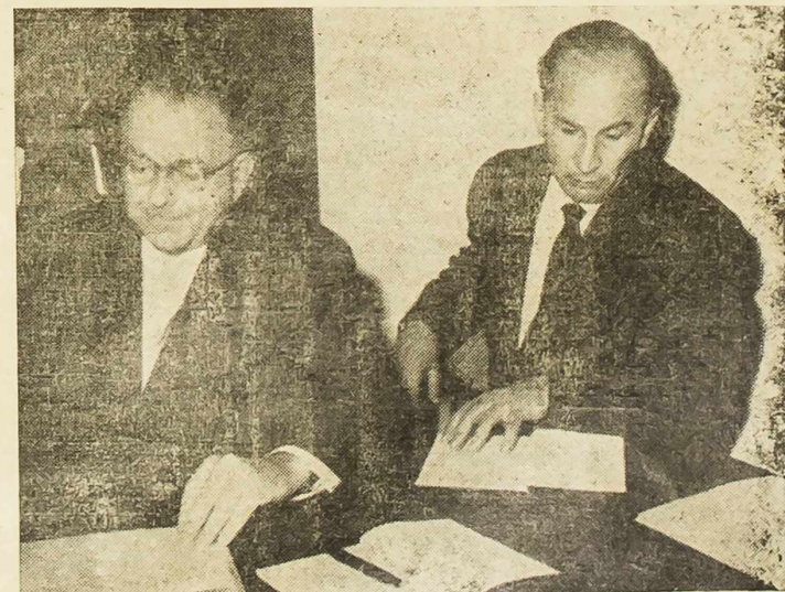
Radno predsjedništvo na sastanku radiologa

Za pomoć Nogometnom klubu »Vardar«, čiji su sportski objekti poslije zemljotresa oštećeni, igrači Nogometnog kluba »Šibenik« upisali su zajam u visini od 150.000 dinara.