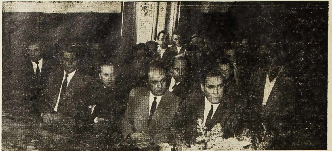
Sa Sindikalne skupštine u Tvornici elektroda i ferolegura

Bilo je i kritičkih primjedbi na rad radničkog savjeta. Taj organ radničkog samoupravljanja, kako je rečeno na godišnjoj skupštini, od svog izbora nije podnio kolektivnu nikakav izvještaj o svom radu.