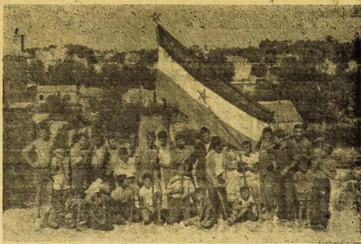
Poslije radne akcije u Dubravicama