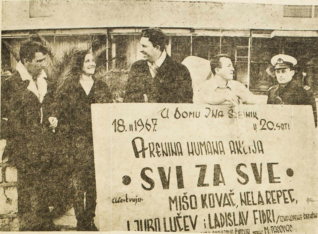
Interpretatori zabavnih melodija prije početka priredbe »Svi za sve«