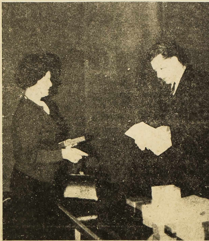
S podjele odlikovanja u Gradskoj vijećnici

»PLAVINA«: Mi smo zauzeli stav još od početka ovih diskusija. Predlažemo da se formiraju dva specijalizirana poduzeća ili jedno jedinstveno. Mislimo da je danas, s obzirom na novu situaciju, stanje takvo da bi ipak bolje došlo jedno jedinstveno poduzeće. Bilo bi to i ekonomski više opravdano. (Nastavak na 2. strani)