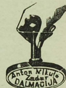
Pečata od gume i mjedi.