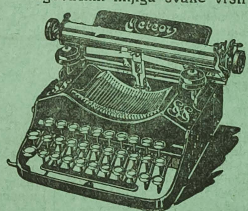
Disaći stroj «Meteor» takogjer hrv. pismom.

POTPLATE od gume i od kože za postole, samo za trgovce i postolare na veliko.