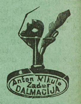
Dećata od gume i mjedi.