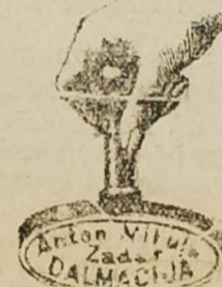
Dečal od gume i mjedi.

Novosti! Slika N. V. Cara KARLA I. u bojama, veličina 73x50, Kruna 3.50. Okvira svake vrsti i veličine jeftino. — Špaga od papira od 1/2 do 6 m/1m. POTPLATE od kože za postole, samo za trgovce i postolare na veliko.