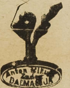
Deat od gume i mjedi.

"MAGNET" űepne lampe svijetle bez baterije.